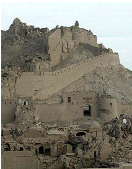
5. Irán. Bam después del violento sismo del 2003.

Puesta bajo la égida de prestigiosas universidades y centros de investigación internacional y realizada gracias a la contribución del “Observatorio Euromediterraneo y del Mar Negro” y a la hospitalidad de la universidad de Estudios de Nápoles “L’ Oriental”, esta revista es difundida gratuitamente por internet, un instrumento precioso que garantizará la fruición del “Web Journal on Cultural Patrimony” a un público mucho más extenso con respecto del limitado círculo de los estudiosos de la materia.