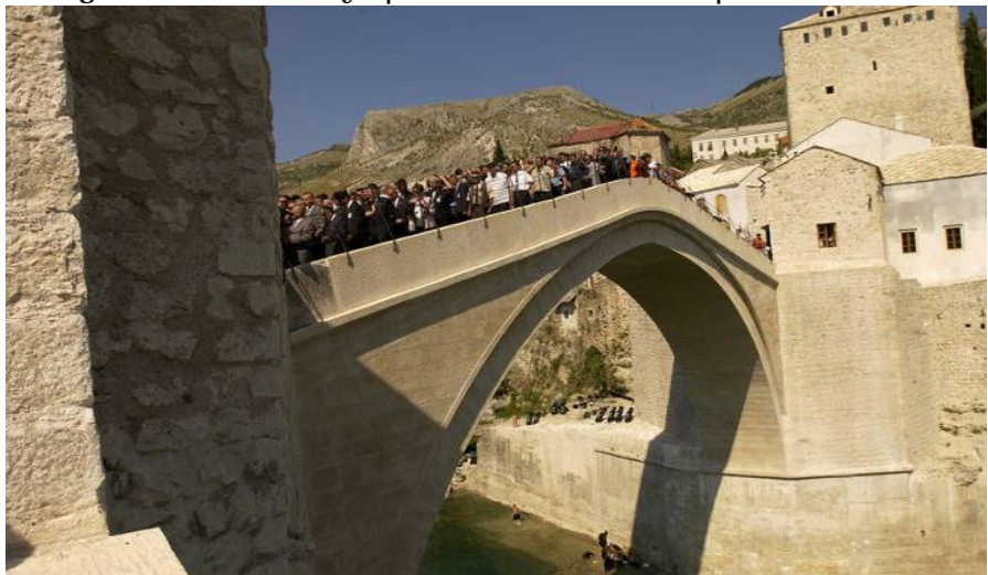
1. Lo Stari Most reconstruido después del cañoneo del 1993.

No creo sea posible transmitir a las futuras generaciones las mismas sensaciones de horror, de desconcierto y de impotencia probadas de quien haya