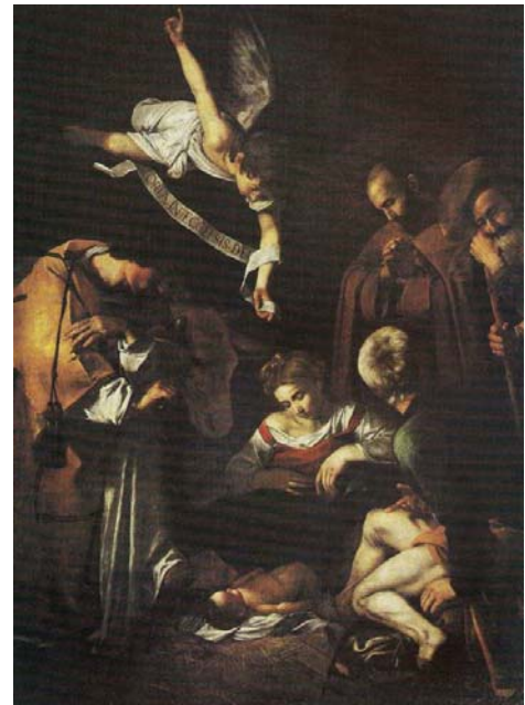
4. Caravaggio, Adoración de los pastores con los Santos Francisco y Lorenzo .