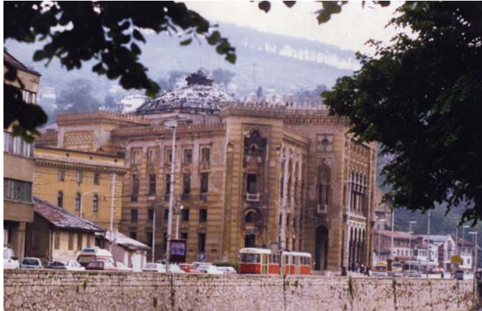
2. Sarajevo. La Biblioteca Nacional y Universitaria.

la Biblioteca de Sarajevo o las Budas de Bamiyán. Igualmente, será difícil describir las percepciones probadas de quien haya tenido modo de visitar las ricas iglesias serbio-ortodoxas, saqueadas, incendiadas e/o minadas por extremistas a kosovaro-albaneses, o bien reproducir los colores, los claroscuros o los detalles de obras maestras del ingenio humano, cuales la adoración de los pastores con los Santos Francisco y Lorenzo del Caravaggio, cuyo ningún duplicado fotográfico o digital podrá devolver nunca el justo mérito.